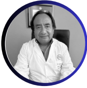
Dr. Gerónimo Huertas Hospital Pablo Soria Jujuy, Argentina

Simposio: Cáncer bucal, su prevención, diagnóstico y tratamiento. Realidad y antecedentes en la región. Propuestas de acción preventiva.