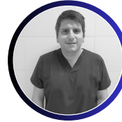
Dr. Fabricio Gómez Maffei Hospital Odontológico de Formosa, Argentina